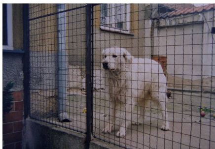
obr. tento slovenský čuvač je trvale umístěn ve voliére v blízkosti domu, kde má stálý kontakt s lidskou smečkou.

Kotec nebo voliéra není nejvhodnější trvalé ubytování pro čuvače. Většinou dochází k odcizení se s lidskou smečkou a pes se cítí po právu odstrkovan. Nuda většinou psa dožene k ničení pletiva nebo podhrabávání. Rozměr kotce pro trvalý pobyt čuvače musí být minimálně 4x4 m a musí v něm být umístěna bouda. Krytý přístřešek je zcela nevhodný, protože nechrání psa před větrem. Pokud chcete čuvače mít pouze jako doplněk k domu, rychle na to zapomeňte. Při nedostatku kontaktu s lidmi se vše projeví na povaze psa a budete nemile překvapeni.