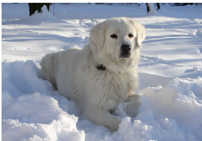
obr. Essy Bílé království – 2 roky

• Nikdy nepoužívejte k zateplení psího pelíšku polystyren, molitan, korek a podobné materiály. Psí hrádky často končí okusováním těchto částí. Tyto materiály mají jednu nepříjemnou vlastnost : jsou lehké a při pozření zůstávají v žaludku psa, plavou na žaludečním obsahu, neposunou se do střev a mohou způsobit těžký zánět žaludku, který může končit i smrtí zvířete. Odstranit ze žaludku psa je lze jen operativně. Z hlediska diagnózy nejsou bohužel vidět na RTG snímku.