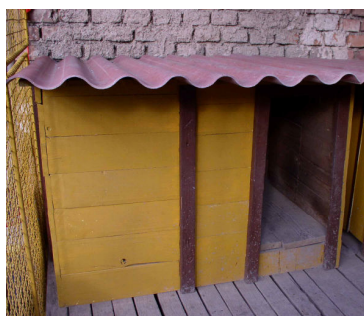
obr. bouda vhodná pro čuvače

kdy bude bouda špatně umístěna se může stát, že v ní nebude chtít pes pobývat. Boudu zhotovíme nejlépe ze silnějších palubek, aby do ní nefoukalo, s odklápěcí střechou kvůli čištění. Rozměry ke zhotovení boudy postačí šířka 120, výška 95 a hloubka 80 cm. Větší rozměry nejsou vhodné, protože pes si musí v chladnějších dnech tyto prostory vyhrát sám svým tělem.